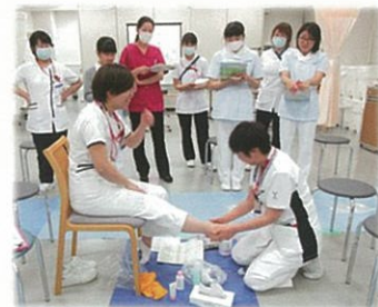
スキルアップセミナー 「認定看護師から学ぶフットケア」

教育部門では、附属病院看護師と看護学生と一緒に学べる自由参加型の学習会を開催し、交流や学びを深めています。